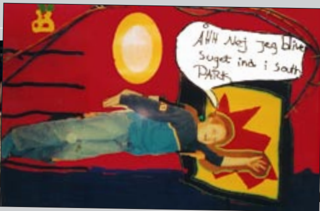
Multimedieprojekt i 4. klasse, 2003