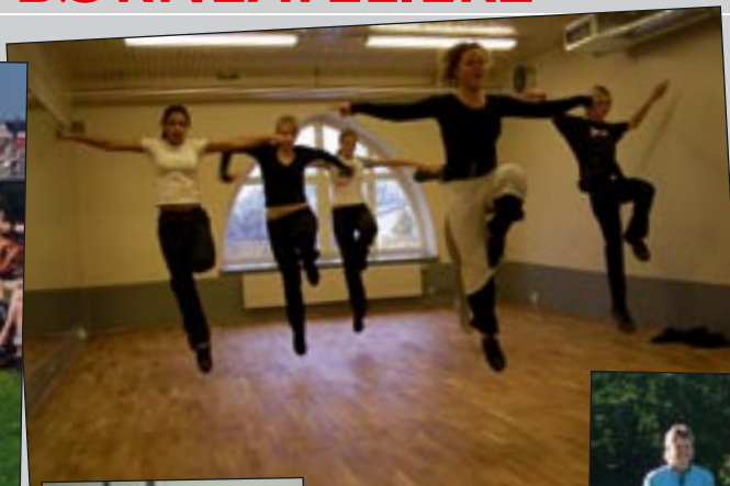
125th Harlem street- dance, 2003-2004

Alternative idrætstimer i 4. klasse, 2006