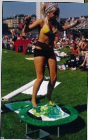
Actionpainting, Kulturhavn, 2004

Alternative idrætstimer i 4. klasse, 2006