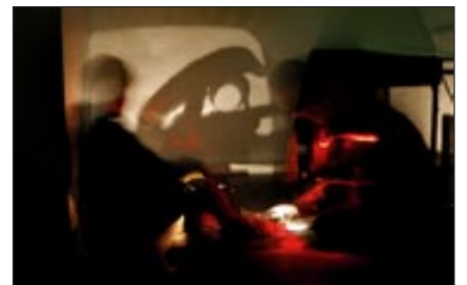
Skyggeskulpturer til kulturhavn, 2006

For den verden er helt sikkert ikke kedelig.