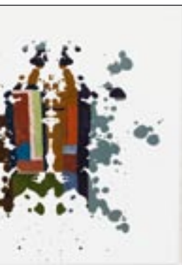
Kaspar Bonnén Looking at You (Rorschach), 2004 olie på lærred, 115 x 115 cm.