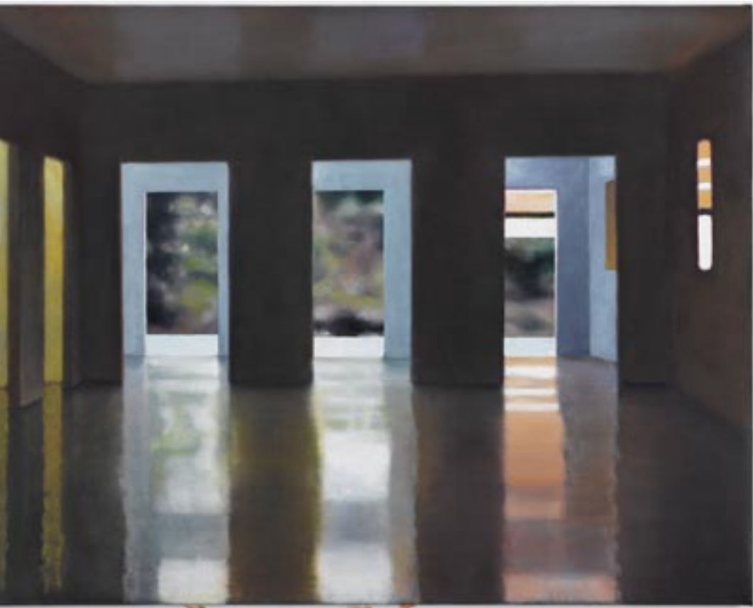
oe Flensburg: untitled, 2007, olie på lærred, 65 x 90 cm.