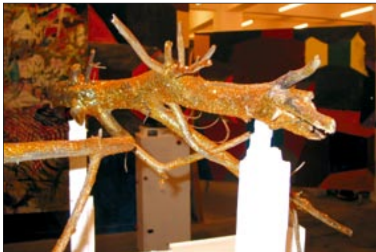
En smukt forgyldt helt almindelig gren.