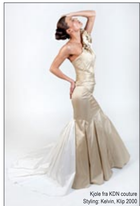
Kjole fra KDN couture Styling: Kelvin, Klip 2000