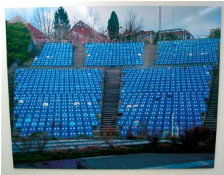
I værket Blue Brothers fra 2005 lader Olaf Breuning tribunens stolerækker google sit publikum med stirrende øjne.

Olaf Breuning: This and that snowmen with carrot noses. Galleri Nils Stærk, Njalsgade 19 C Tirs-fre 12-17, Lør 12-15 til den 22. april. www.nilsstaerk.dk