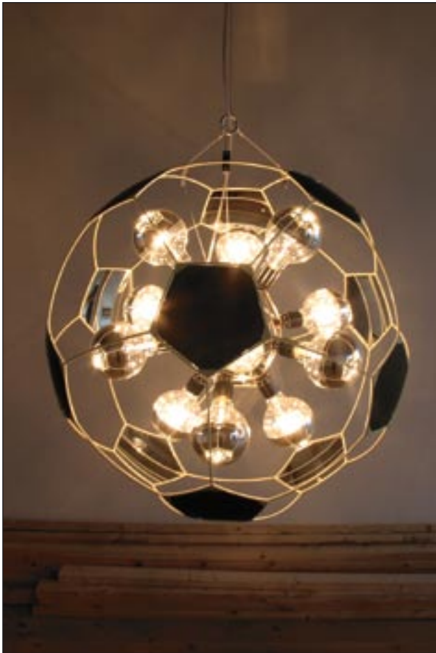
En Olafur Eliasson-klassiker: Lysekronen som videnskabeligt eksperiment.

Olafur Eliasson »Omgivelser« Galleri Andersen_S Islands Brygge 43 Til den 18. marts www.andersen-s.dk