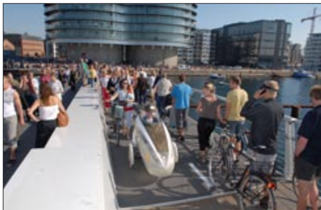
Cykel Logisk Institut drøede over Bryggebroen i denne strømmede sag.

– Vi skal have lukket den ene vejbane på Øresundsbroen. Der er alligevel næsten ingen biler, og man skal