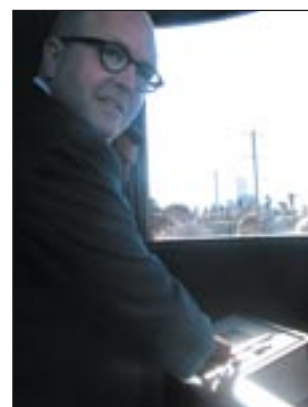
Bondam trykkede knappen ned, så broen svingede på plads.

Pind ærgrede sig ikke over, at det ikke var ham, der skulle trykke på knappen, så brofaget kunne dreje på plads. Den ære var forbeholdt den nye borgmester, Klaus Bondam.